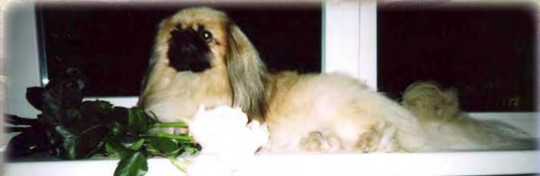
Глеб Чегодин. Тюлик