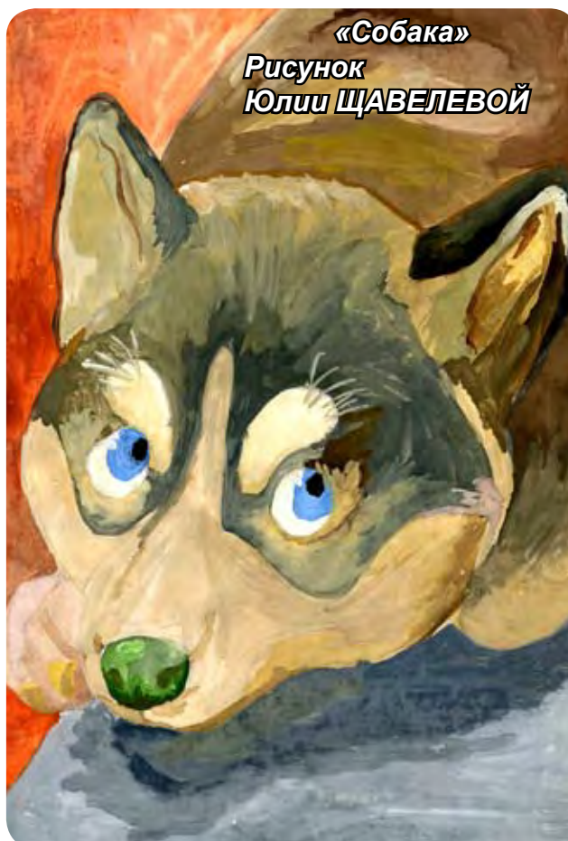
Рисунок Юлии ЩАВЕЛЕВОЙ

Со скуки на людей полаю, Устала под дождём ходить, И шерсть свою я отряхаю - Не удаётся просушить. Хвостом тоскливо помахаю, Схожу из лужицы попить И блох зубами погоняю - Под дверь усядусь: я не злая, Я, если надо, буду выть. Подруга верная, я знаю, Меня должна здесь приютить.