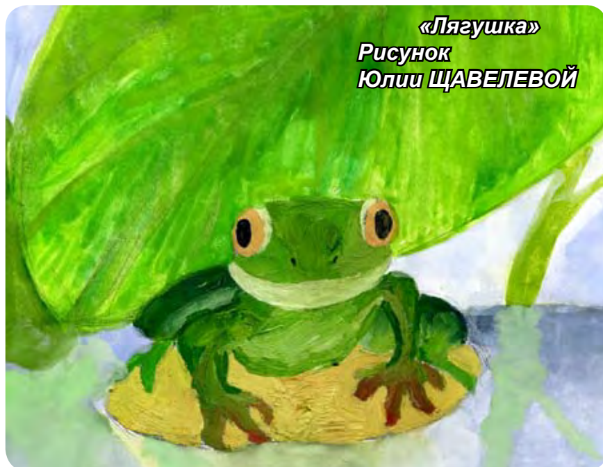
Рисунок Юлии ЩАВЕЛЕВОЙ

Живёт в аквариуме Лягушка, Безвольно по стеклу скребёт, И видит бедная квакушка Мирок, где всё наоборот. Там Лес, уютная опушка. И тварь по паре там живет. Как жаль! Зелёная подружка Стен из стекла не разобьёт.