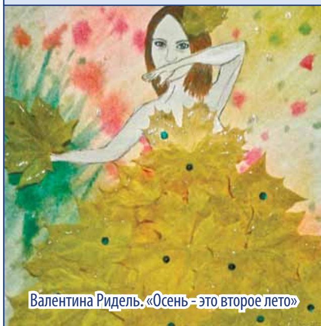
Валентина Ридель. «Осень – это второе лето»