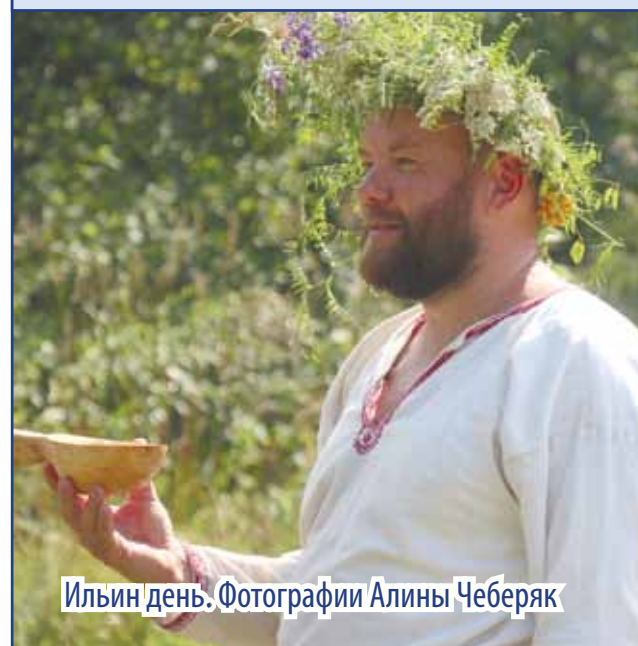
Ильин день. Фотографии Алины Чеберяк