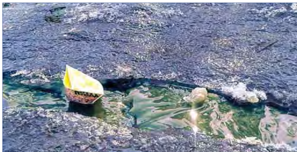
фотография ученицы Лицея №103 Алины Чеберяк, 2017 г.