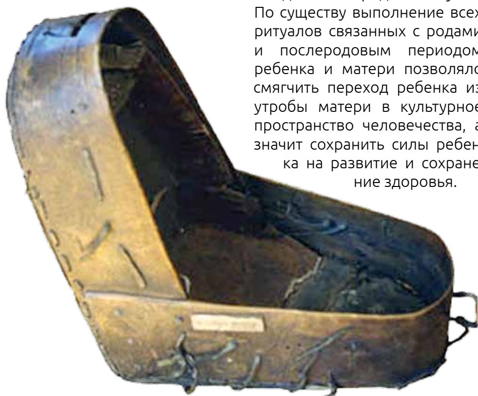
эмке - эвенкийская колыбель

У всех народов Кавказа тоже были и есть детские колыбели. У чеченцев эта традиция сохраняется до сих пор. В Чечне используется детская люлька - «ага». Она очень удобна. Мать