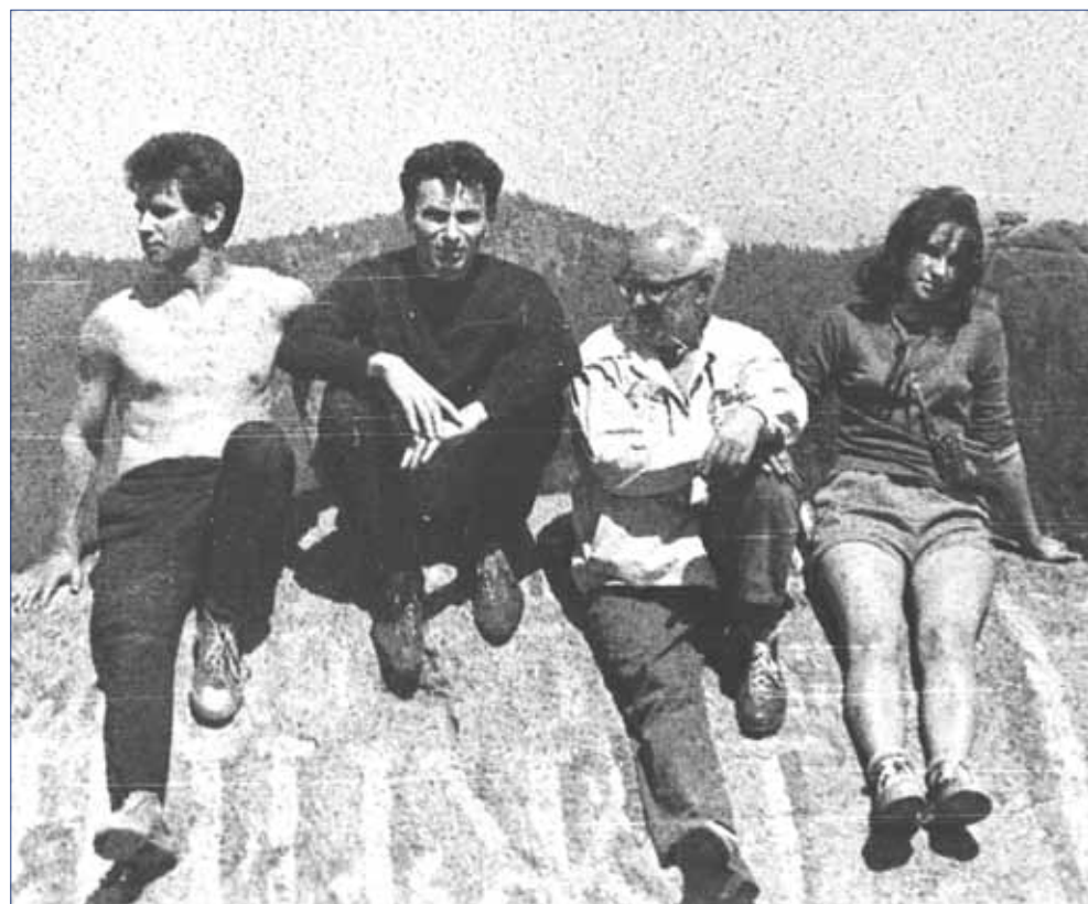
на Красноярских «Столбах»

- Утром бег на стадионе. Дважды в день еда. Работа за конторкой над книгами, обобщение мировых достижений науки о человеке (генетика, физиология, психология, биология и др). Слежу за суровыми политическими играми. В процессе работы несколько раз могу сделать небольшие физкультминутки. Больше нажимаю на «бога здоровья» - на позвоночник. Источник вдохновения - священные писания, сакральные послания в мегалитах древних допотопных цивилизаций, музыка (ежедневно минимум по часу играю