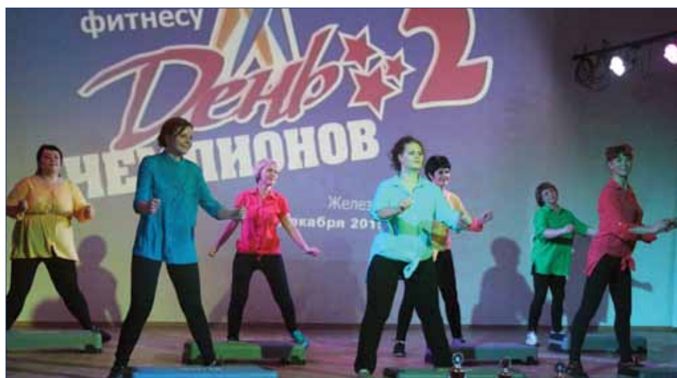
фитнес-фестиваль «День чемпионов в Лицее №103, 2015 г.