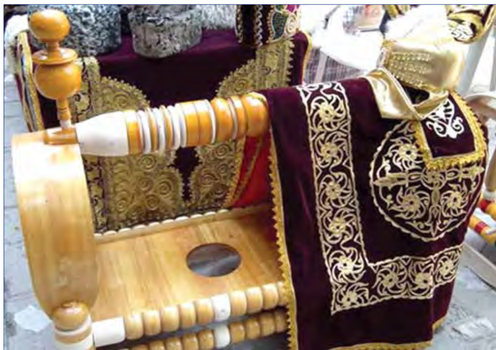
бешик - традиционная восточная колыбель

может, брать ее с собой в любое место - на полевые работы, в огород и т. д. Люлька легко перевозится на верховой лошади, машине.