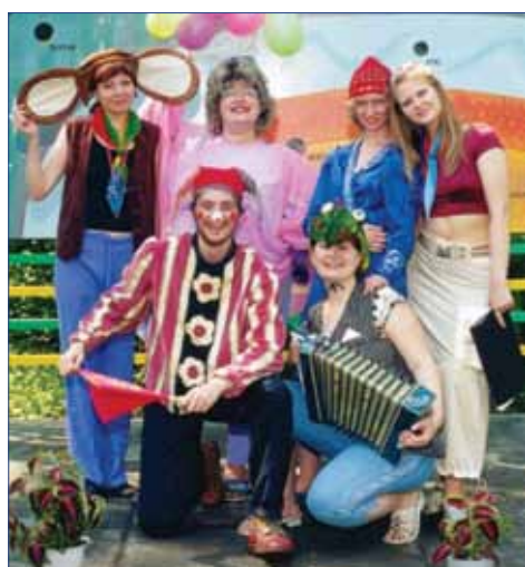
Лагерь «Звёздочка», последний сезон, 2003 г.