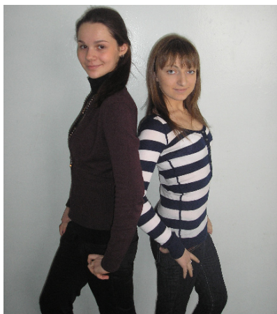
Так, в старших классах учится

В нашем лицее все без исключения девушки лучшие. И каждая из них хороша по-своему, каждая из них представляет собой индивидуальность.